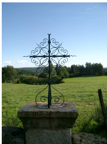
Croix à La Fayolle

Circuit familial : 5,5 Km 2h00 (Raccourci 4.4 km)