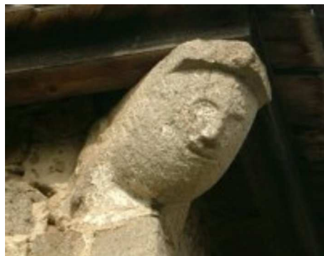
Corbeaux à la Rivoire